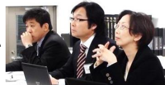
第5期MP講座 in 新潟 マーケティングアドバイザー

MP講座では「担当アドバイザー制度」を設けています。 課題をどのように作成したらいいかわからない、学習方法がわからないという悩みを遠慮なく相談できるシステムとなっています。